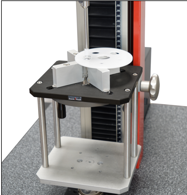
Prüfaufbau mit Universalhalterung, Auflagehalterung und Druckstempel